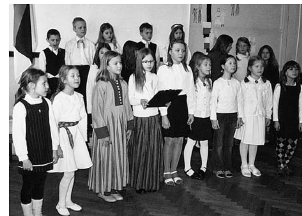
• Lastekoor esinemas vabariigi aastapäeva aktusel

Traditsiooniline vastlapäev möödus väga lõbusalt 23. veebruaril. I-IV klassi lapsed kelgutaskid pargis ja sõitsid paarissõitu kooli liuväljal. Parimad said nagu ikka