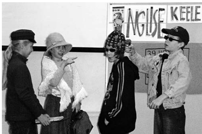
• Inglisekeelset näidendit esitamas