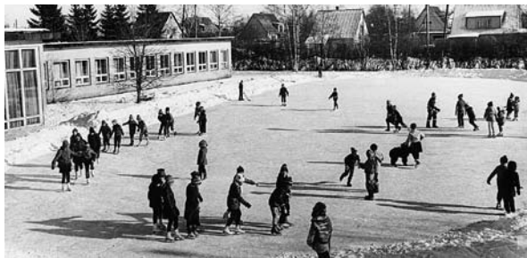
• Kui ilmataat lubab, on liuväli aastaid olnud Merivälja Algkooli lahutamatu osa

Igal talvel oli lastel liuväli, mis tehti õpetajate ja lastevanemate jõududega. Liuvälja ja kelgumäe entusiast