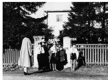
• Lahkumine vanast koolimajast