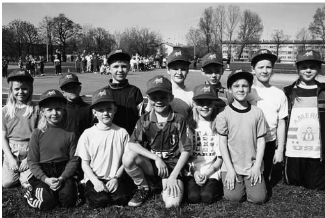
• Meie kooli võistkond