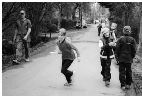
• Merivälja Laste Päeva teatejooks

Õppeaasta lõpetas Merivälja Laste Päev 2. juunil 2001. a. Tegevust jagus terveks päevaks. Kooli hoovi olid püsti pandud batuudid, toimusid võistlused krossijooksus, köietõmbamises, legode kokkupanemises, paberlennukite lennutamises, asfaldijoonistustes, täpsusviskamises jne. Kohal olid ka loomaarstid ja toimus kohalike krantside näitus.