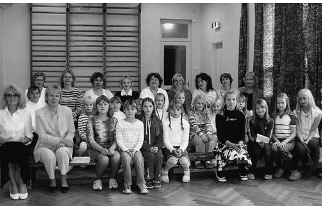
• Õpetajad esinejaid vaatamas