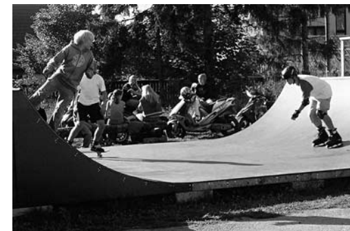
• Võistlus rambil

4. oktoobril osalesime võileibade valmistamise konkursil K. Pätsi Vabaõhu-koolis. Osales 5. klass ja toodi ära 3. koht tordi eest „Laev”.