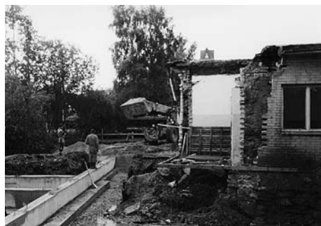
• Vana koolimaja koridori lammutamine