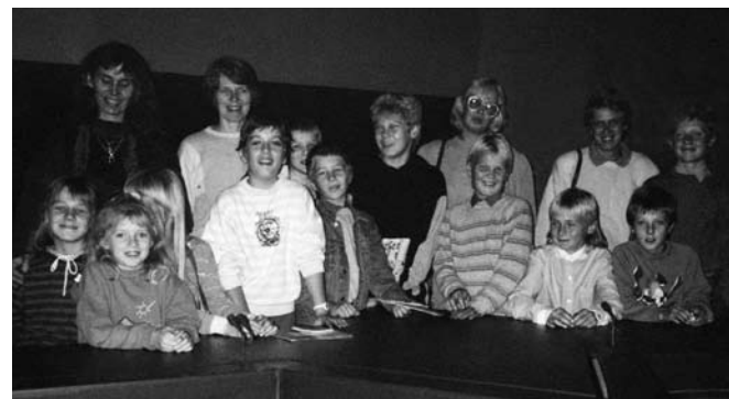
• Soomes Pasila teletornis