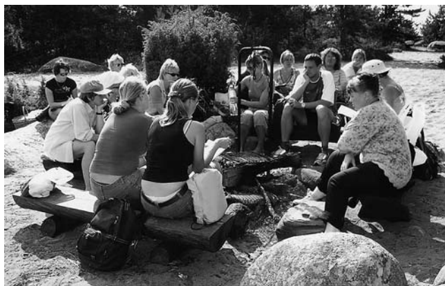
• Koosolek vabas õhus

Õppeaasta algas õpetajatele seekord teistmoodi. Nimelt toimus augustikuu õppenõukogu Mohni saarel, kus 100% õpetajatest kohal oli.