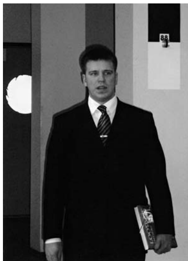
• Tallinna linnapea Jüri Ratas kooliperet tervitamas

27. veebruaril kogunesid kõikide klassi-