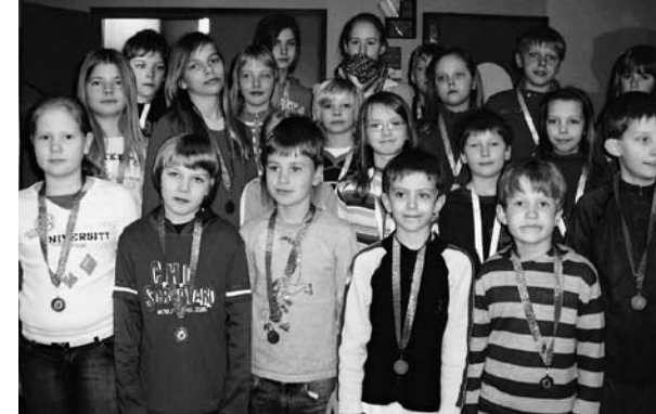
• Orienteerumisvõistluse võitjad

11. aprillil kogunes kogu koolipere kooliõuele, et alustada orienteerumismängu. Võistkonnad rivistatud, jaotati kätte „legendid”, mille järgi liikuda. Ühtekokku osales 19 võistkonda, igas võistkonnas 7-8 liiget. Autasustamisel said 1., 2. ja 3. koha omanikud medali. Parimatele liiklustestide lahendajatele auhinnaks helkurid ja klepsud.