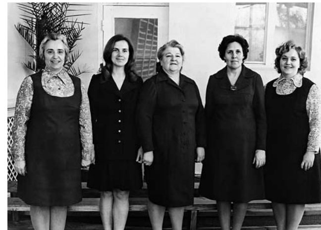
• Tallinna 35. Algkooli põhikaader: