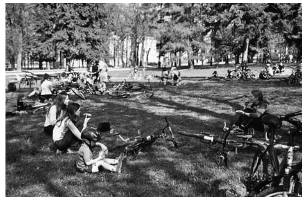
• Jalgratturid Kadrioru pargis puhkamas

Jalgrattamatk suundus 26. mail Kadriorgu presidendilossi poole. Osa võtsid 75 jalgratturit. Kõige rohkemaarvulisemalt olid esindatud algklassid, kes olid suutnud kaasa meelitada ka hulgaliselt lapsevanemaid. Sõideti mööda jalgrattateed Kadriorgu, lossi juures kuulati juttu presidendi ametimajast ja tiigi ääres võeti kehakinnitust. Ohutu tagasitee kulges jälle mööda vastvalminud uut jalgrattarada.