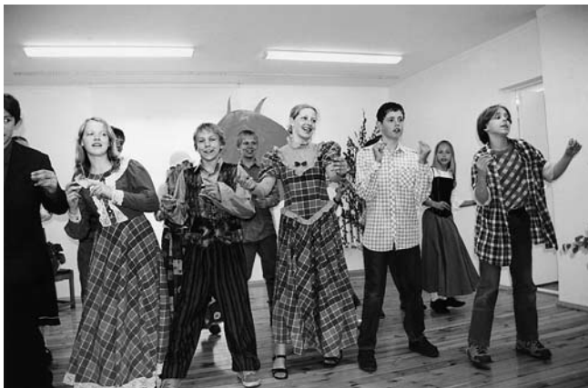
• Oklahoma etendus Viimsi Kultuurikeskuses