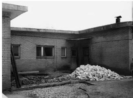
• Sel kohal asub nüüd ujula