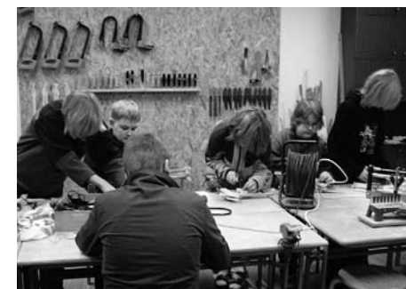
• Õpilased uues tööõpetuse klassis

9. septembril toimus ülelinnaline tervisepäev. Meie lapsed läksid osa jalgsi, osa jalgratastega Botaanikaaeda seene- näitust uudistama. Seal täideti ka asjakohast küsimustikku, otsiti seeni ja korjati kummaliste puude lehti.