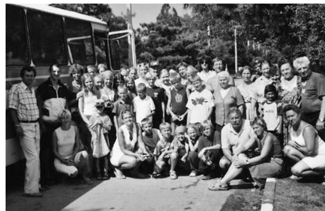
• Ärasõit Beregovojest