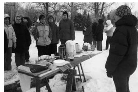
• Õpetajad stressikoolitusel õues einet võtmas