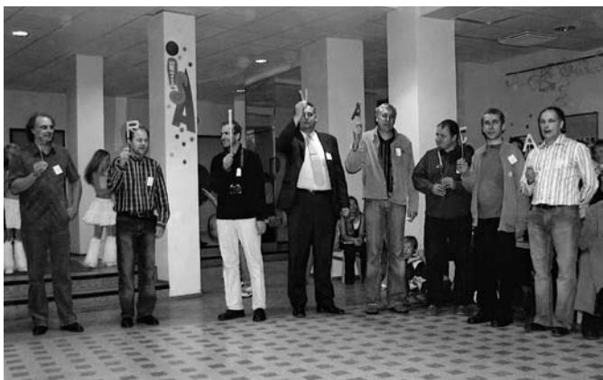
• Novembris oli jälle isadepäev

Mida tehakse sünnipäevalapsele külla minnes? Kallistatakse, soovitakse palju õnne ja lauldakse talle! Seda tegime ka meie – võtsime oma kooli ümbert käsikäes kinni ja kallistasime teda! Meid jätkus täpselt ja meie ahel ei katkenud. Hüüdsime koolile hurraa ja laulsime-trallisime.