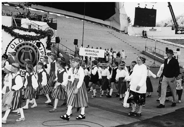
• Merivälja Algkooli lapsed laulukaare all

Suvel võttis õp. Imbi Kõiver oma tantsulastega osa laulu- ja tantsupeost.