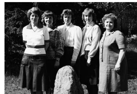
• 1989. a. kevadel töötas Merivälja Koolis 5 pedagoogi