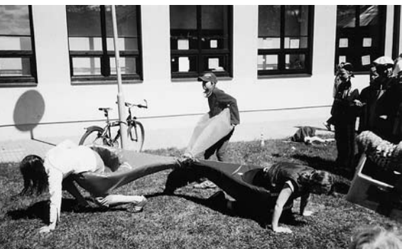
• Võistlus „kutsikate“ vedamises