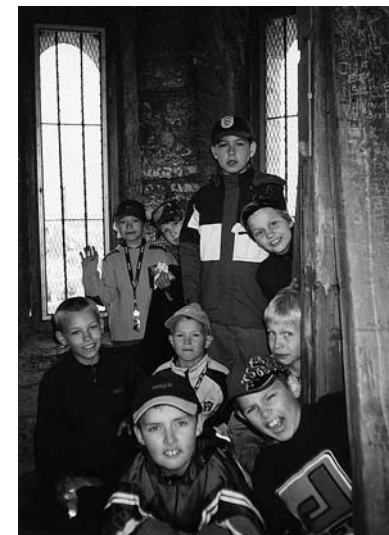
• Linnalaagri lapsed Raekoja tornis

Õhtuti käidi diskoõhtutel, kus oli ka noored Kiievid ja teistest Venemaa linnadest. Mõni tütarlaps kippus oma südantki sinna jätma. Õnneks jõudsi-me ikka kõik õnnelikena koju ja soov tuksub südames, järgmisel aastal jälle tagasi minna.