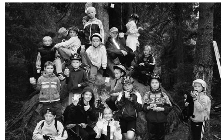
• Randveres kivil kasvava kuuse juures

Selle aasta jalgrattamatk toimus 27. septembril ja vaatamas käidi kivil kasvavat kuuske Viimsi metsas. Matka pikkus oli umbes 15 kilomeetrit ja osavõt- jaid nagu tavaliselt, veidi üle saja.