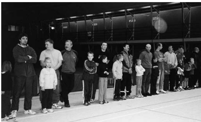
• Isadepäeva võistlusest osavõtjad... võistlejad

Isadepäev toimus seekord spordiüritusena Viimsi Spordihallis laupäeval, 9. novembril. Osalema oli tulnud üle 40 isa koos oma lastega, mõnel kaasas ka emad, et oleks, kes kaasa elab. Isad jagati nelja võistkonda, et pidada maha rahvastepalliturniir ning hiljem ka teatevõistlused.