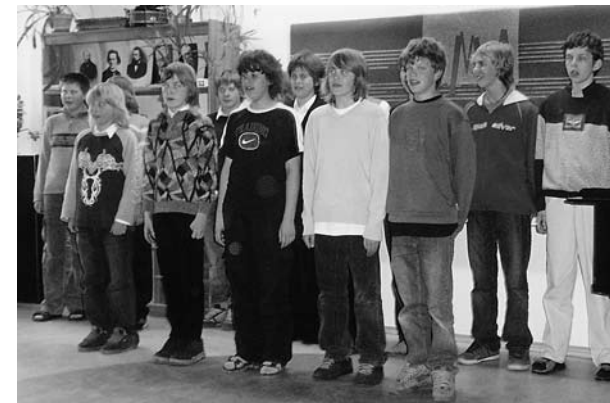
• Kuuendate klasside poisid laulmas

11. mail esinesid meie laulu- ja tantsulapsed Merivälja Pansionaadi eakatele inimestele ja oma emadele, vanaemadele.