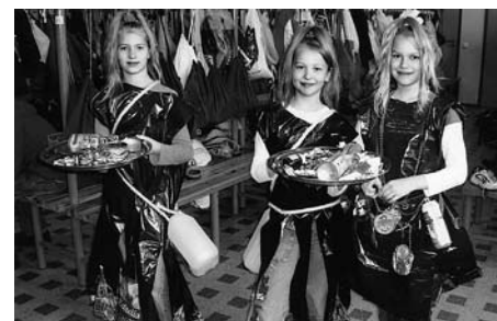
• Moekonkursi võitjad

Poisid tegid põhiliselt punk- ja mototeemalisi riideid, oli ka „kiliseb-koliseb” teemat, kus nii plaadid kui ka ketid-korgid ära olid kasutatud.