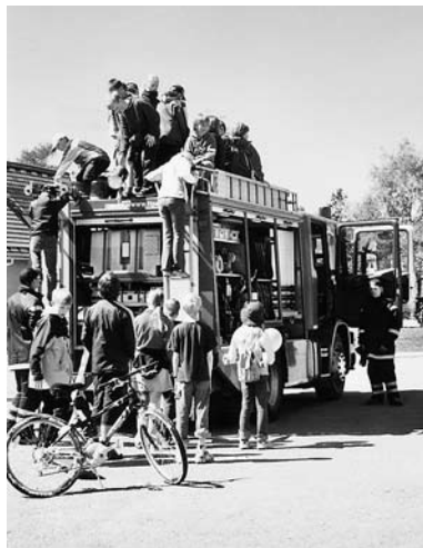
• Tuletõrjetehnika demonstratsioon

Kooliaasta lõpetamine oli eriline. Lahkusid meie koolist 6. ja 8. klass. Head ja kiitvat oli aktusel öelda direktoril, sest 41 õpilast autasustati kiituskirjaga. Esma-kordselt lõpetas 18. juunil 9. klass. Kas see jääbki ajalooliseks? Oleme ju sügisest taas 6-klassiline kool. Lõpueksamid olid mõnedele õpilastele väga rasked, aga kooli lõpetasid siiski kõik.