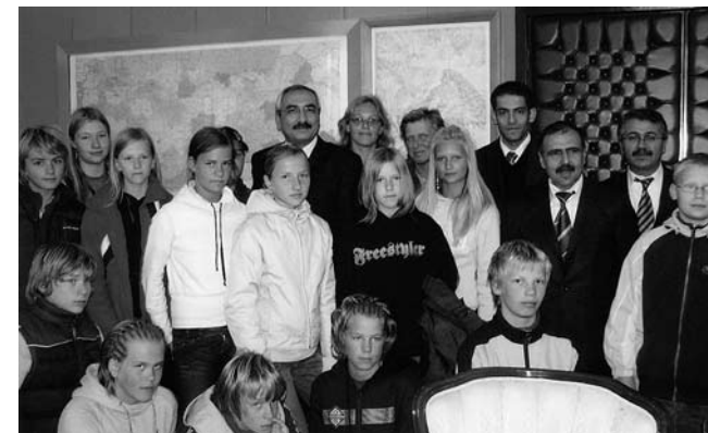
• Meie lapsed Ispartas linnapea vastuvõtul

Oktoobris ja novembris olid meie koolis türgi nädalad. Nimelt käisid meie lapsed ja õpetajad oktoobri lõpus külas sõpruskoolis Türgis, Ispartas ja türkklased olid kaks nädalat külas meie peredes. Tegemist oli keelelaagriga, mille eesmärgiks oli inglise keele praktiseerimine ja tutvumine meie kultuurist nii erineva maa nagu Türgi igapäevaeluga. Ispartas elasid lapsed samuti peredes ja nende inimeste külalislahkust ja sõprust saime tunda igal sammul. Lapsed vahetasid magamiskohti iga paari päeva tagant, sest kõik tahtsid koos elada nii kaugelt tulnud külalislahkustega, nagu meie seda olime. Tallinnas näitasime oma külalistele vaadet teletornist, sõitsime uiskude ja kartautodega, jalutasime vanalinnas, mängisime bowlingut, külastasime Pärnu veeparki jpm. Loodame, et nad jäid nende üritustega rahule.