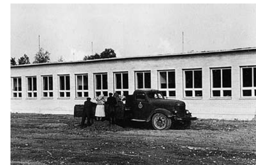
• Kolimine Heki teele

Uus koolimaja Heki teel sai valmis 1960. aastal. 1. septembril selles tööd veel alustada ei saanud, kolimine toimus alles oktoobris.