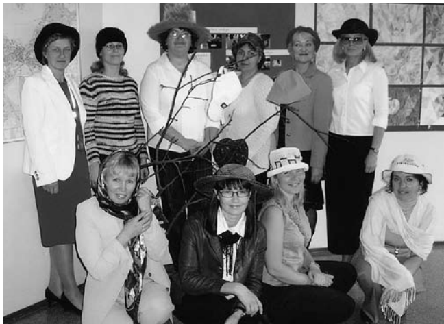
• Õpetajad oma kübaraid demonstreerimas

2 päeva oli väljas õpetajate „kübarapuu”. Lapsed pidid õpetajad ja kübarad õigesti kokku panema. Võitis 3b klass, kes arvas 14-st kübarast õigesti ära 6 õpetaja kübarad.