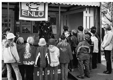
• Õpilased näitust uudistamas